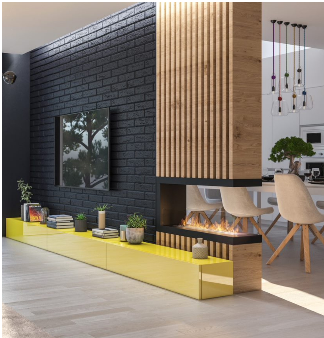
Biokominek Inside U1000.2